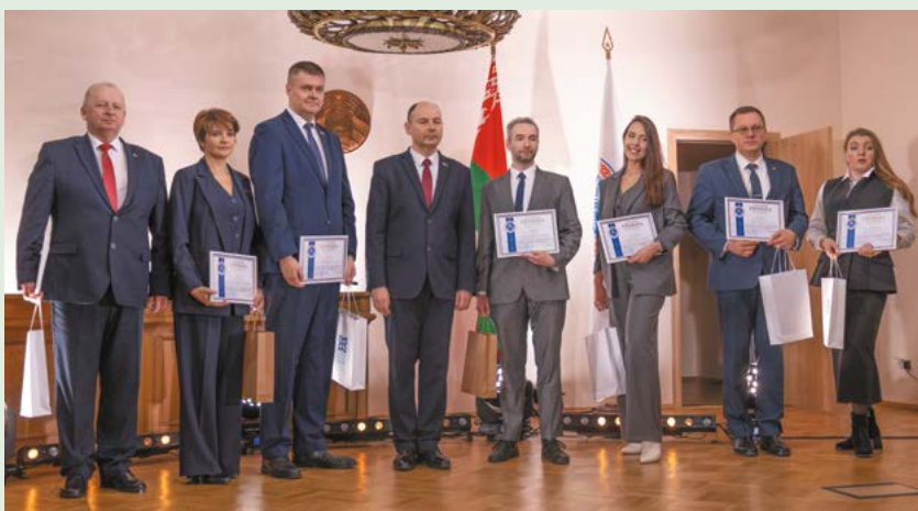
Работники отрасли, награжденные Почетной грамотой Министерства энергетики Республики Беларусь