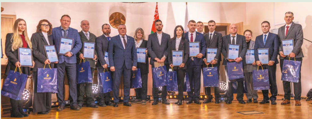
На торжественной церемонии награждения работников отрасли, принявших участие в подготовке и сопровождении экспозиции Министерства энергетики на выставке «Моя Беларусь»