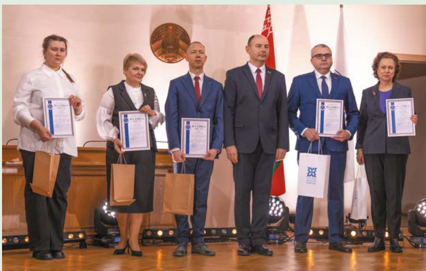
Работники отрасли, удостоенные Благодарности Министра энергетики Республики Беларусь

Фото Анастасии Данюковой, участников экспозиции