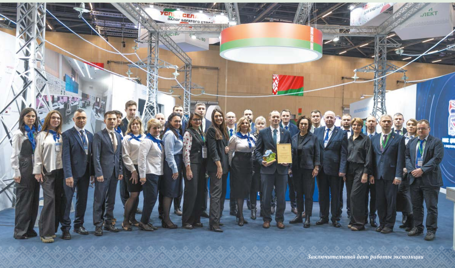
Заключительный день работы экспозиции

Взрослым напоминали о правилах подключения электрооборудования в ванной комнате и функциях устройств защитного отключения, демонстрировали нарушения, часто встречающиеся при пользовании электрическими и газовыми приборами.