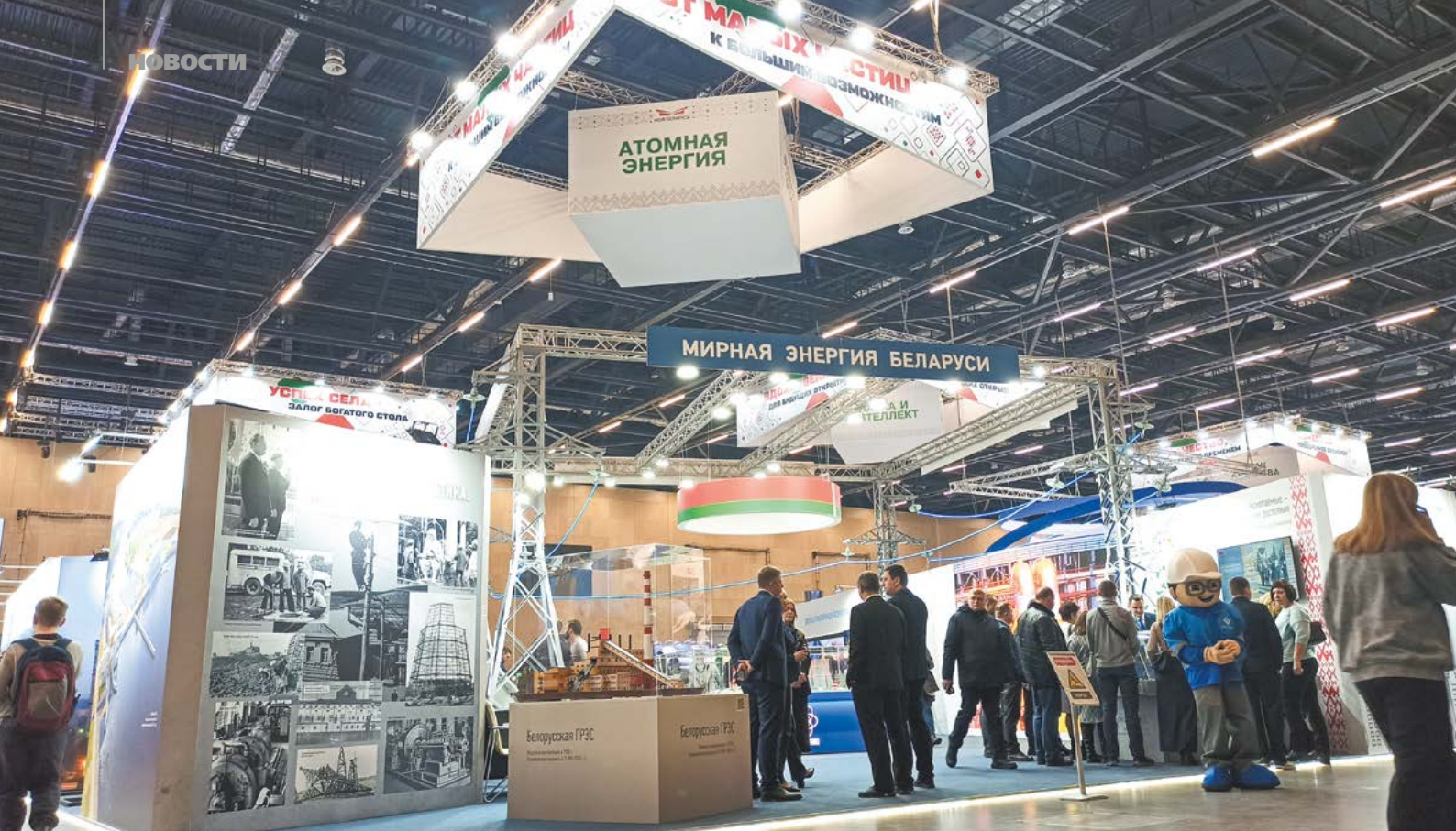
Экспозиция Министерства энергетики «Мирная энергия Беларуси»

Не меньший интерес вызывал почти пятиметровый макет тепловыделяющей сборки ядерного реактора БелАЭС – ТВС, состоящей из 312 топливных стержней – ТВЭЛов. В активную зону реактора загружаются 163 такие сборки. Это самое современное и эффективное ядерное топливо, имеющее успешный опыт эксплуатации на аналогичных энергоблоках – на нем работает каждый шестой энергетический реактор в мире.